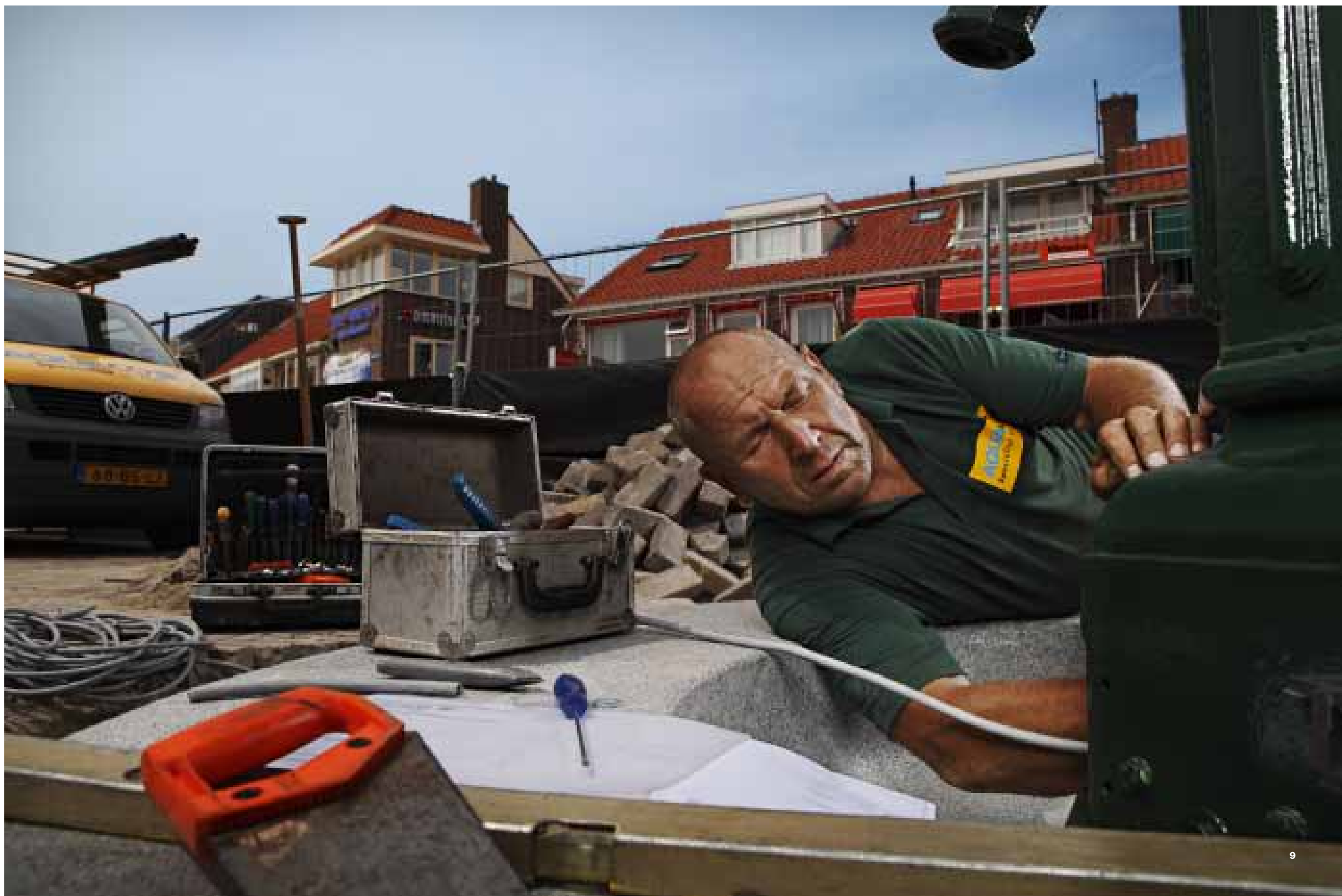
Monteur Ap aan het werk op locatie in Egmond aan Zee.